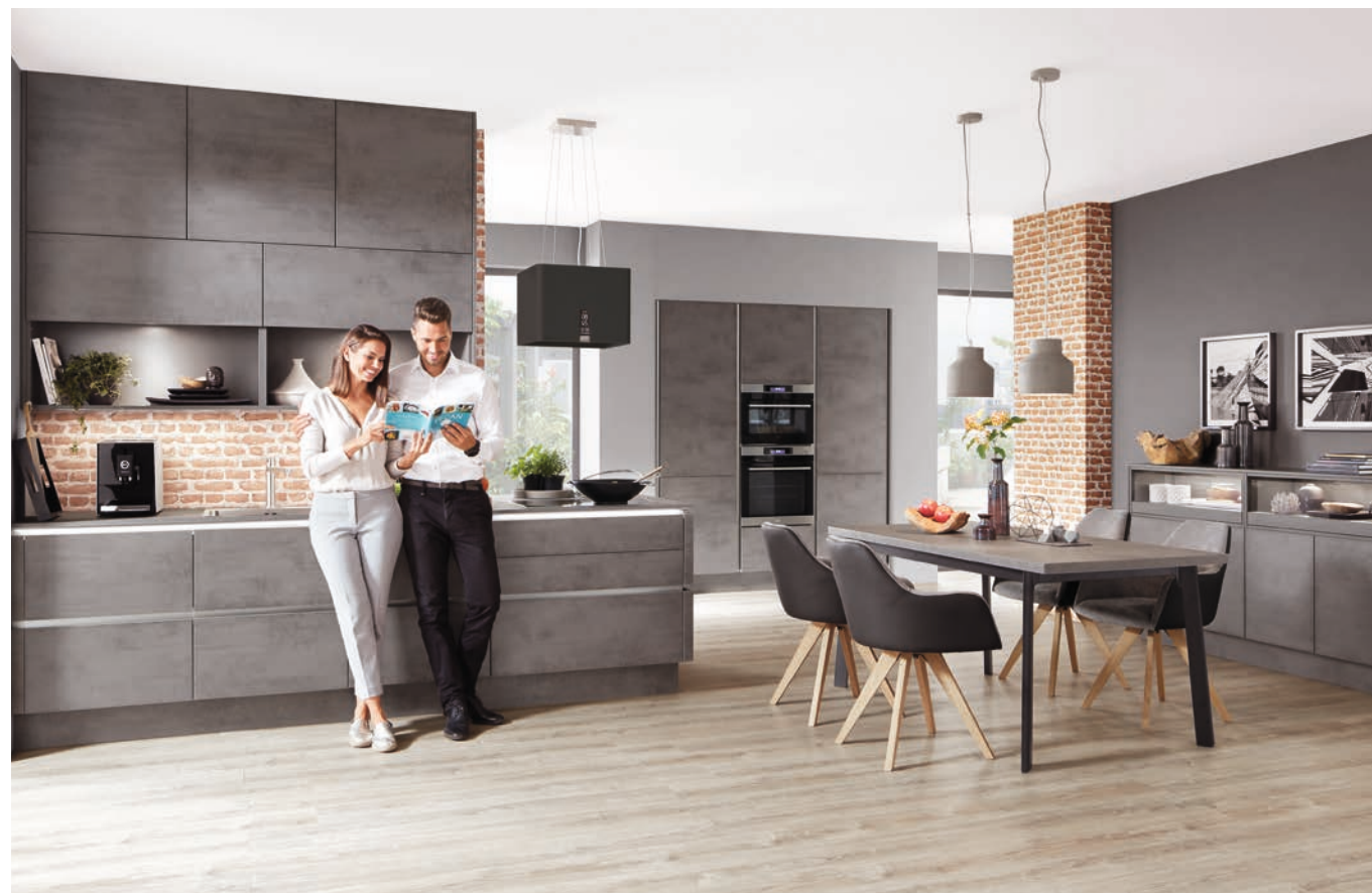
Das Dekor Beton schiefergrau Nachbildung bietet Nobilia jetzt auch als Frontdekor für „Riva“ an.