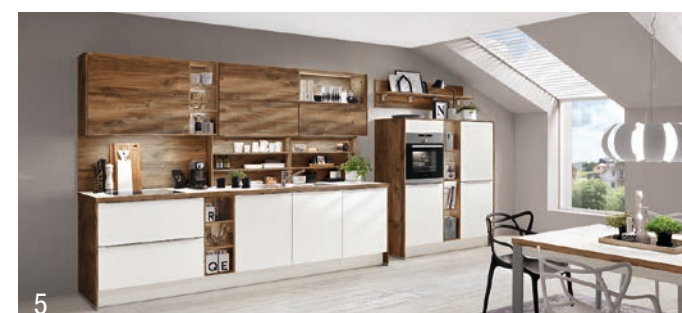
Viel Spielraum zur individuellen Küchengestaltung bietet das um Rusty Plates (1), Caledonia (2), Oriental (3) sowie um die Holzdekore Eiche Havelland Nachbildung (4) und Balkeneiche Nachbildung (5) erweiterte Color Concept.