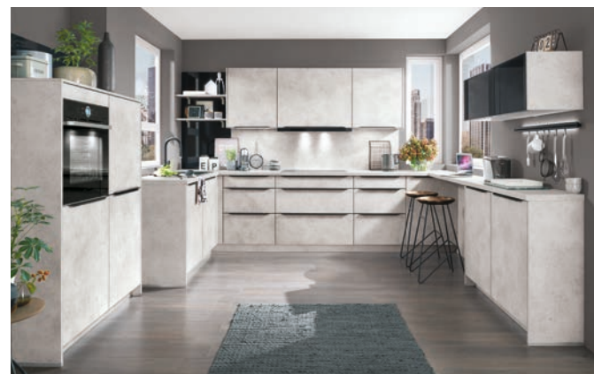
Auch im Preiseinstieg wartet Nobilia mit neuen Möglichkeiten auf. Ansprechend kommt beispielsweise „Speed“ in Keramik Grau Nachbildung (Preisgruppe 1) daher.

Zum Kombinieren mit Metall- und Steinoptiken lädt auch das Color Concept von Nobilia ein. Drei neue Farben bieten