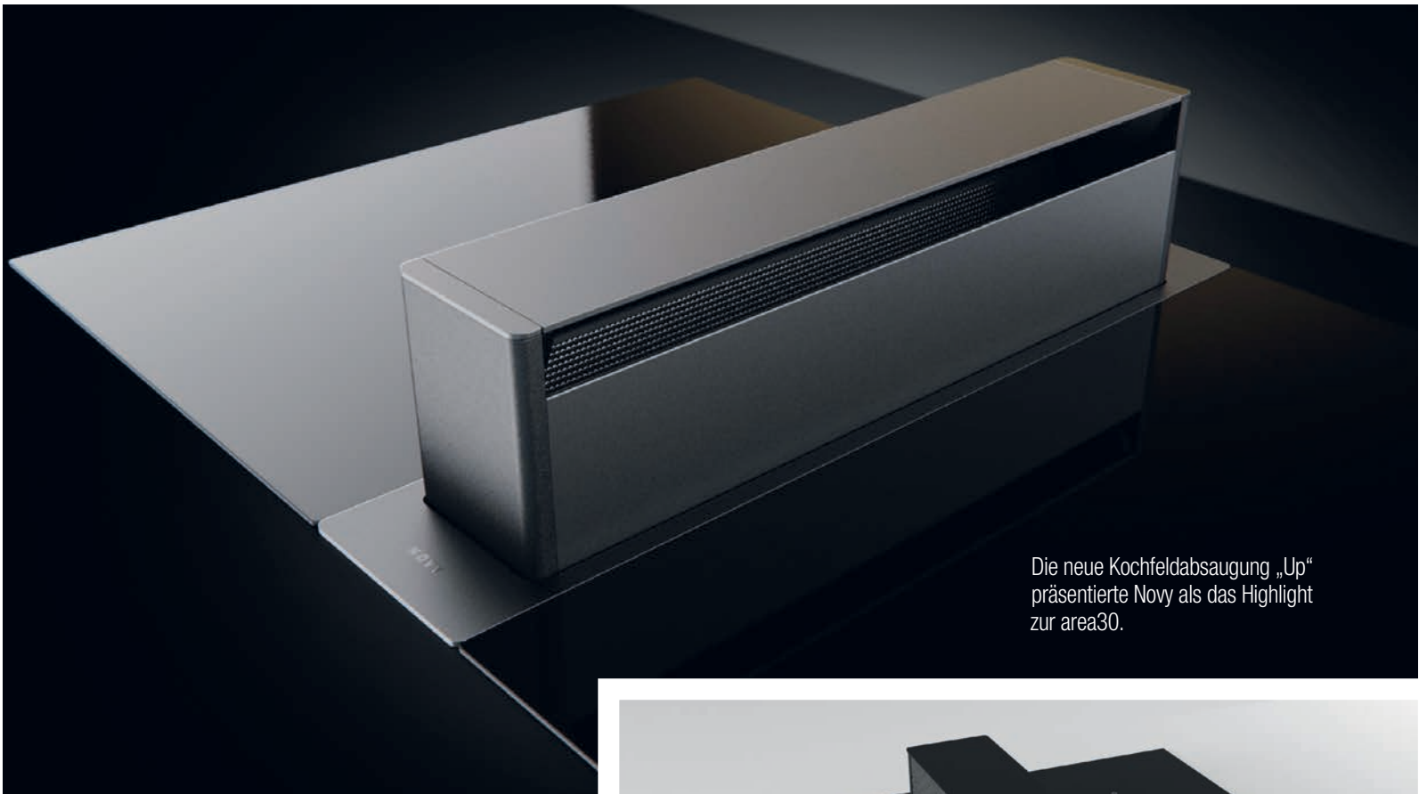
Die neue Kochfeldabsaugung „Up“ präsentierte Novy als das Highlight zur area30.