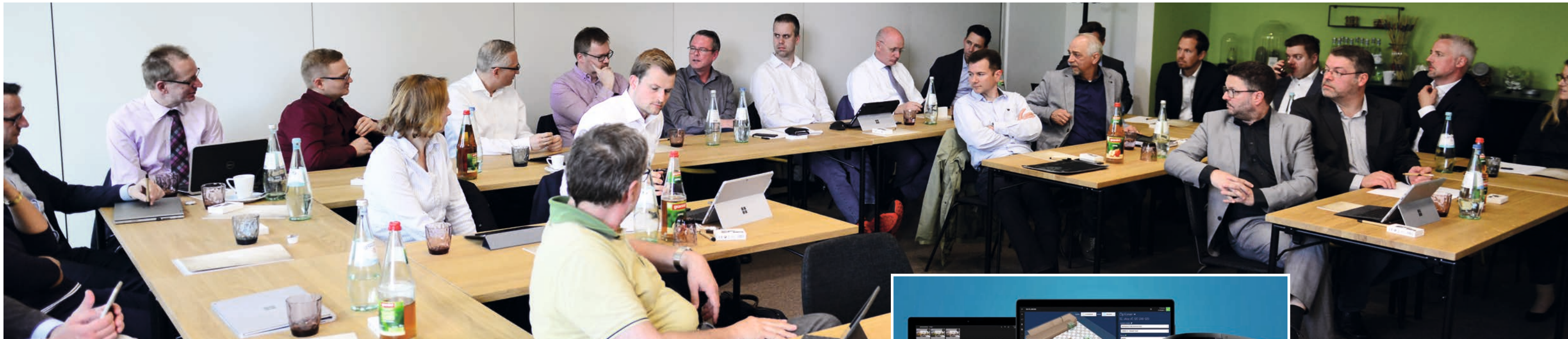
Das erste „Diomex Kundenforum 360° 2018“ vom 17. bis 18. April in Bad Oeynhausen bot den „XcalibuR“-Händlern ausreichend Zeit für angeregte Diskussionen zu branchenrelevanten Themen wie IDM.