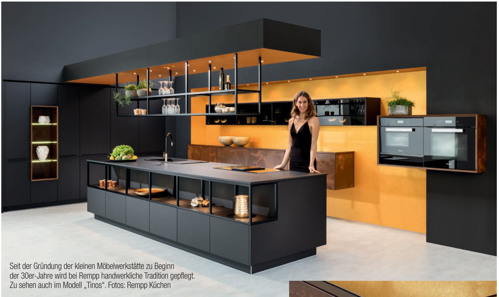
Seit der Gründung der kleinen Möbelwerkstätte zu Beginn der 30er-Jahre wird bei Rempp handwerkliche Tradition gepflegt. Zu sehen auch im Modell „Tinos“.